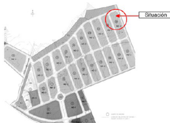
MPPO (Expte. 101/1997) Recorte del Plano Nº 5 "Zonificación Modificada"

Por cuanto queda expuesto se formulan las siguientes