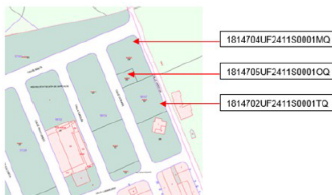
Situación sobre plano catastral