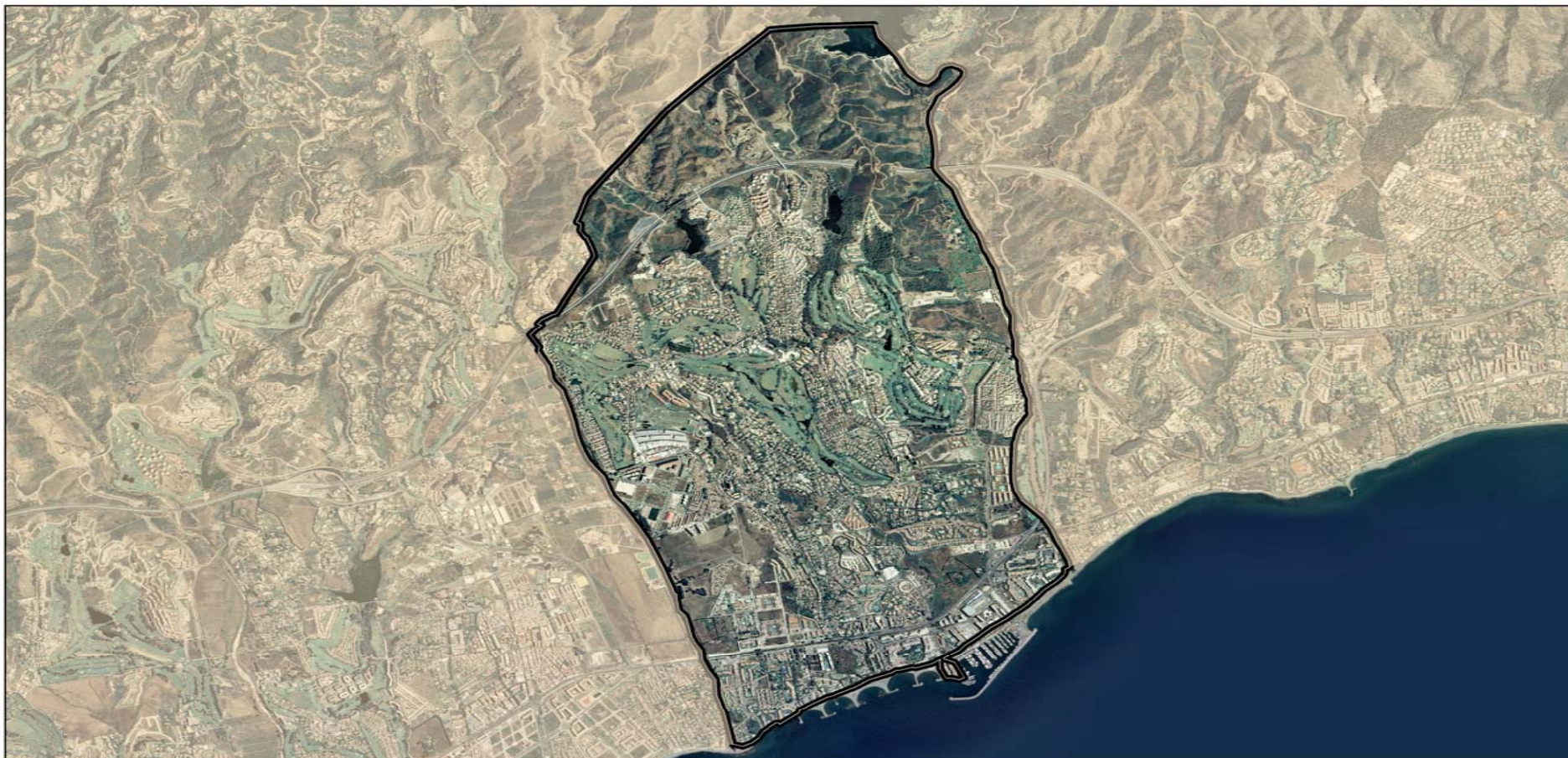
DISTRITO 3 Escala 1:28000