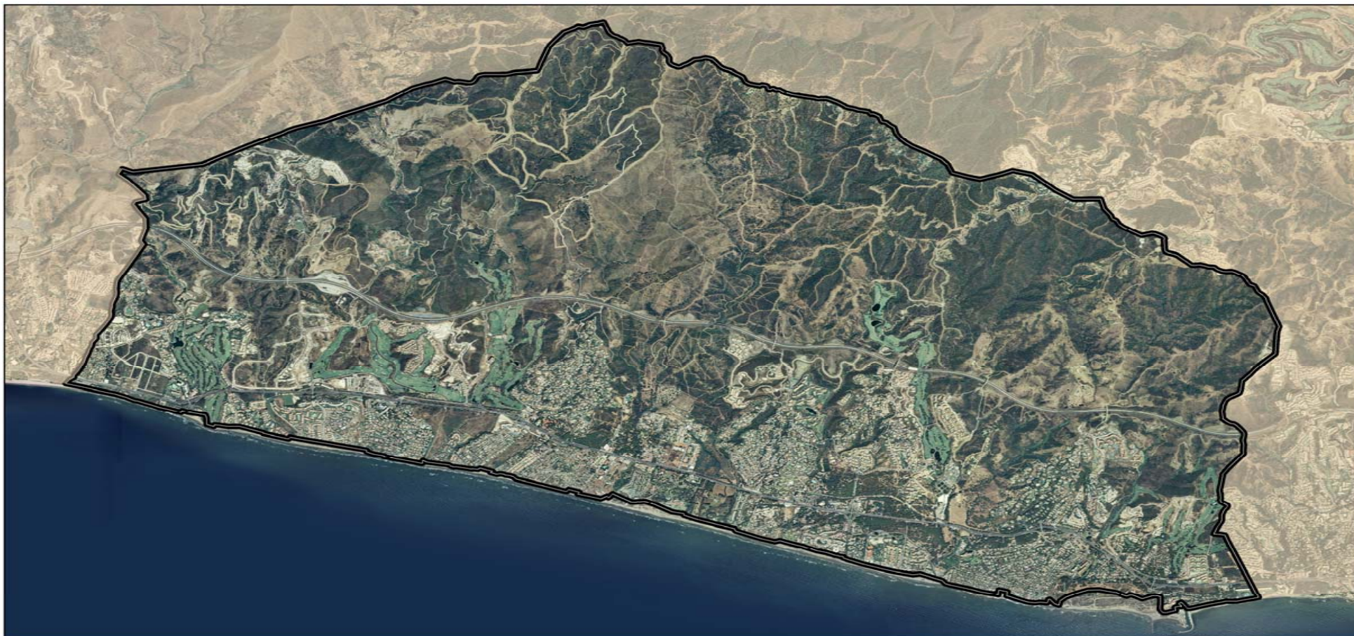
DISTRITO 9 Escala 1:31000