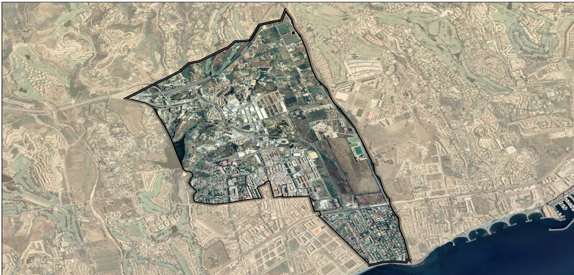
DISTRITO 2 Escala 1:16000.