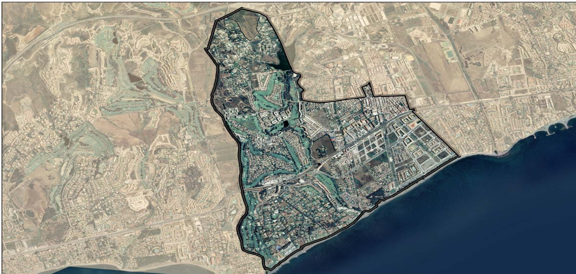
DISTRITO 1 Escala 1:18000