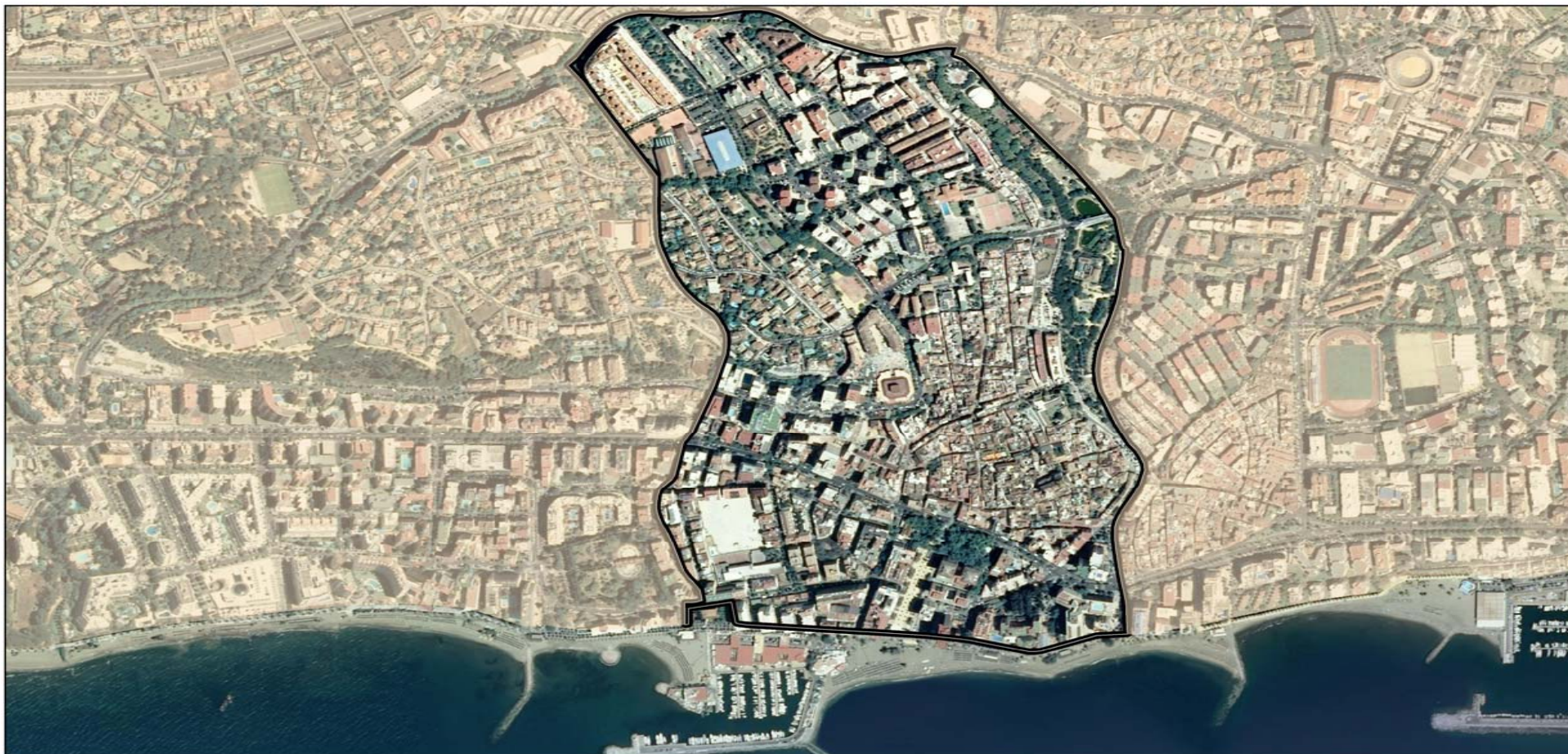
DISTRITO 6 Escala 1:6000