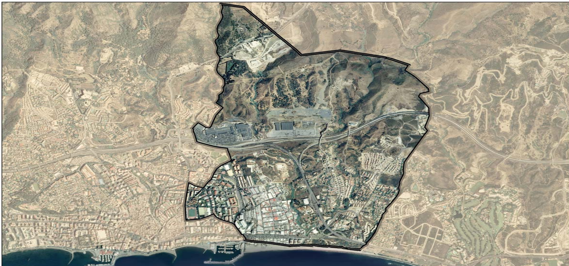
DISTRITO 8 Escala 1:15000