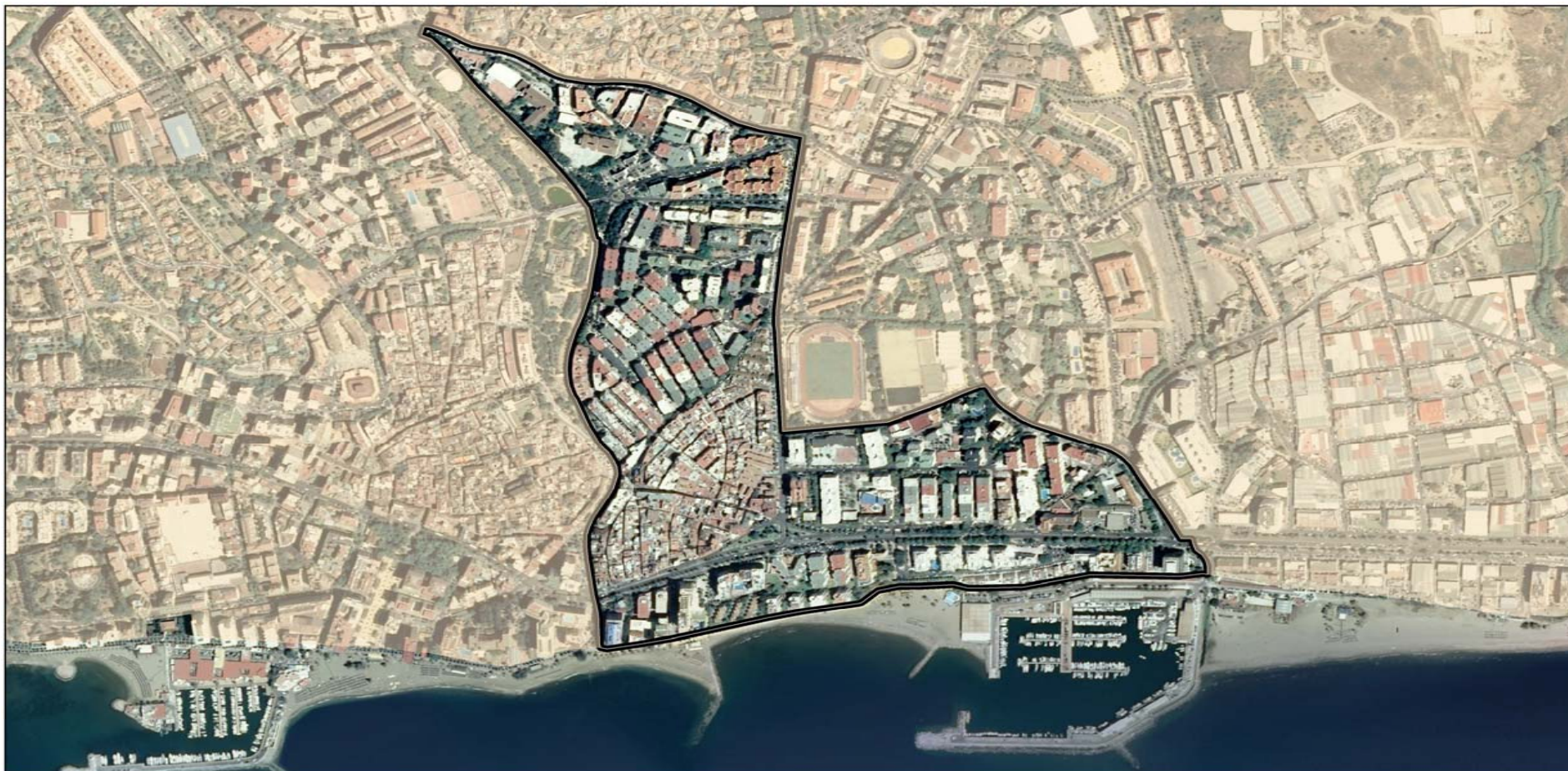
DISTRITO 7 Escala 1:15800