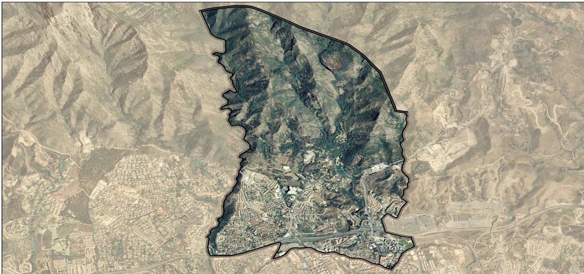
DISTRITO 5 Escala 1:18000