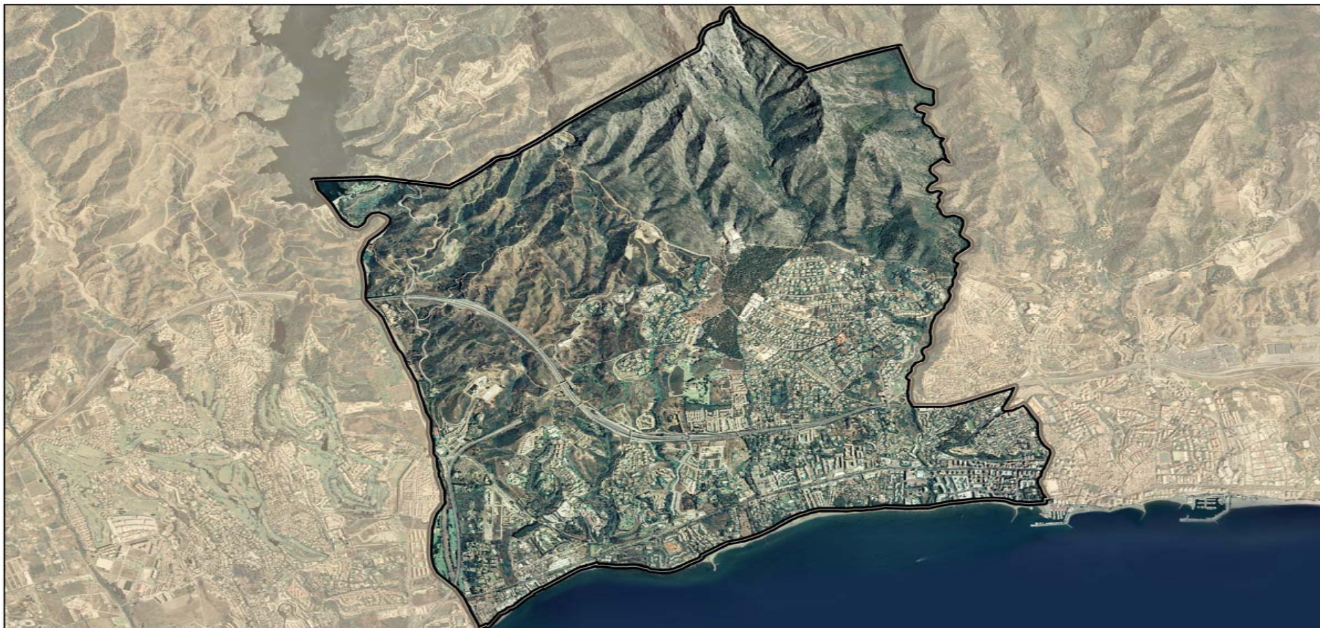
DISTRITO 4 Escala 1:28000